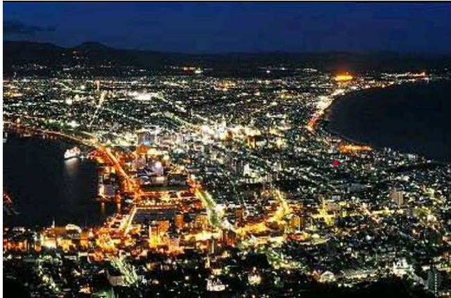
函館山からの夜景(イメージ)

函館の魅力は夜景だけではなく。季節ごとの旬の海鮮料理の宝庫でもあります。そんな函館と紅葉前の奥入瀬溪流、美しい佇まいの湖・十和田湖、津軽藩ゆかりの城下町・弘前を訪ねていきます